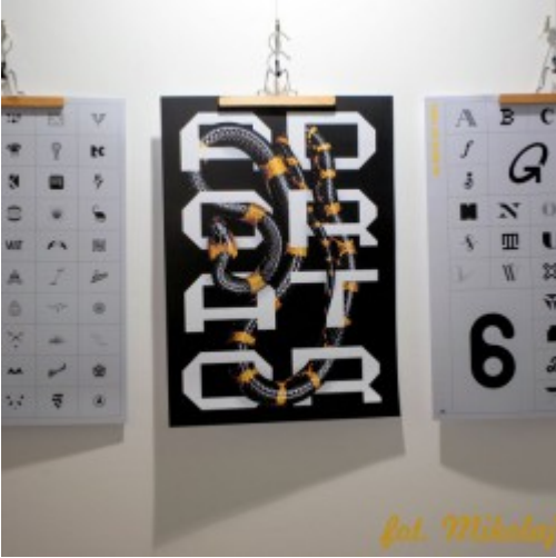
fol. Mikolaj [9]