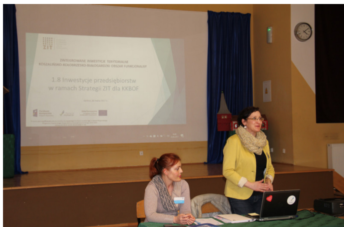
Spotkanie informacyjne dla przedsiębiorców w ramach Działania 1.8 RPO WZ - Kołobrzeg; 13.03.2017 r. [7]