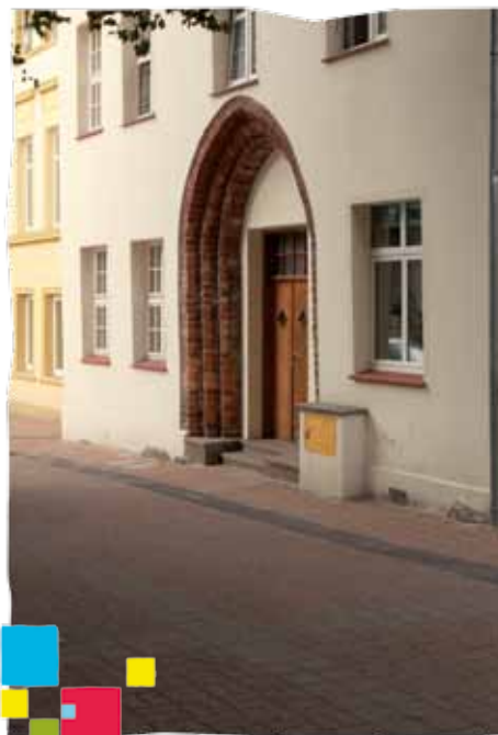
Kamienica z XIV w.