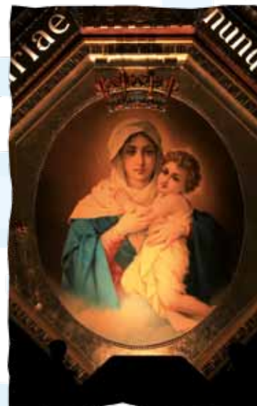
Obraz Matki Boskiej Trzykroć Przedziwnej

cy Ducha Świętego i Matki Syna Bożego jest wszędzie podobny. W 2000 r. miała miejsce koronacja obrazu bursztynową koroną. W 2011 r., za sprawą kardynała Stanisława Dziwisza, w ołtarzu kaplicy umieszczona została relikwia – kropla krwi błogostawionego Jana Pawła II, zamknięta w krzyżu papieskim. Dziś tak jak dawniej do sanktuarium przybywają rzesze pątników, aby wymodlić łaski: za domowienia, wewnętrznej przemiany i gorliwości apostołskiej, a także podziękować za łaski już otrzymane. Pątnikami do sanktuarium byli obaj prezydenci Rzeczypospolitej, którzy zginęli w katastrofie smoleńskiej.