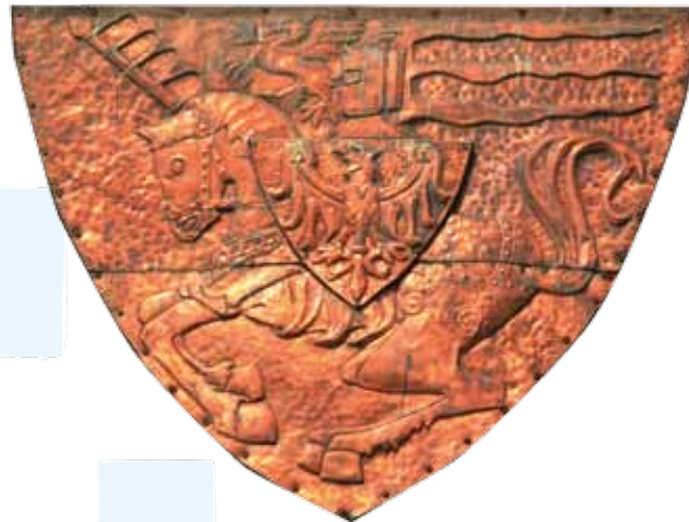
Herb Koszalina umieszczony na budynku ratusza

Jest to najstarszy zabytek miasta wzniesiony w latach 1300-1333. Reprezentuje najczęściej spotykany na Pomorzu typ budowli – bazylikę z wydłużonym, zamkniętym trójbocznie prezbiterium oraz z wnętrzem sklepieniem gwiaździstym i kwadratową, masywną wieżą. W ołtarzu głównym znajduje się 16 figur gotyckiego pentaptyku z 1512 r., ponadto w prezbiterium na belce tęczowej można zobaczyć krucyfik z końca XIV w. Witraże powstały w latach 1914-1915. Kościół wyposażony jest w organy o barokowym