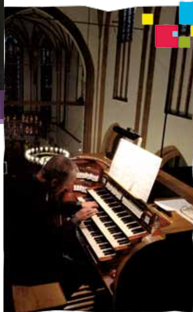
Międzynarodowy Festiwal Organowy

W sezonie letnim można wysłuchać utworów muzycznych interpretowanych przez czołowych polskich i europejskich organistów. Urozmaicony program przewiduje także występy chórów, orkiestr symfonicznych i zespołów muzycznych często z towarzyszeniem solistów. Organizatorem festiwalu jest Koszalińska Filharmonia im. Stanisława Moniuszki.