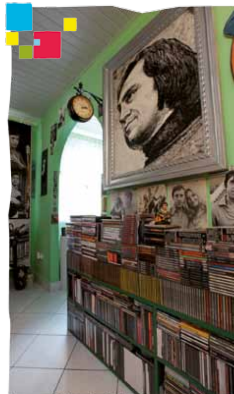
Muzeum Włodzimierza Wysockiego

Działa od 1997 r. w zabytkowym budynku Wydawnictwa Kurtiak i Ley w Koszalinie przy