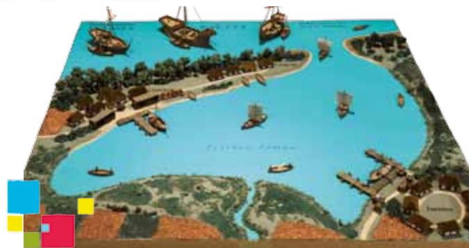
Makieta portu Koszalin XIV-XVII w. - Muzeum w Koszalinie

Bezpotomna śmierć księcia Bogusława XIV, ostatniego Gryfity w 1637 r. sprawiła, że zaczęto realizować warunki traktatu sukcesyjnego zawartego z Brandenburgią, w wyniku którego Hohenzollernowie stali się władcami Pomorza Zachodniego, a do swojej tytulatury dodali „książę (...) Pomorza, Kaszub, Wendów”. Decyzje te zapisało w traktacie westfalskim, który kończył wyniszczającą Pomorze i Koszalin wojnę