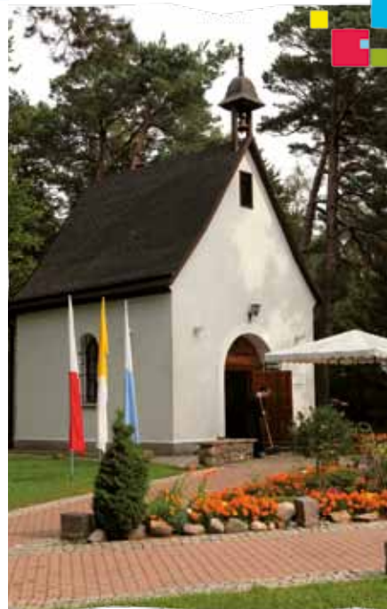
Sanktuarium Przymierza na Górze Chełmskiej