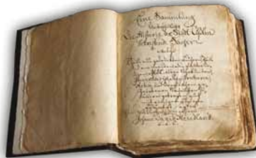
Kronika J.D.Wendlanda z XVIII w.

Zwiedzanie całości ekspozycji wymaga wcześniejszego uzgodnienia z zarządem