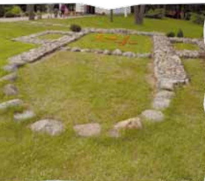
Fundamenty kaplicy z XIII w.

gła zniszczeniu. Ocalał po niej gotycki krzyż zawieszony obecnie w łuku tęczowym koszalińskiej katedry.