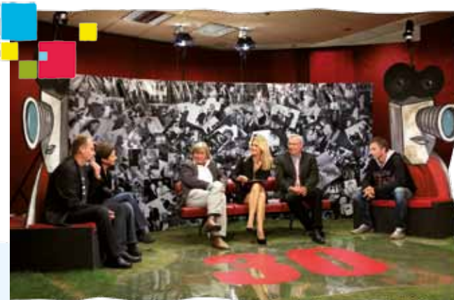
Festiwal „Młodzi i Film”

Jego początki sięgają lat 70. XX w., kiedy to wzorem śre-