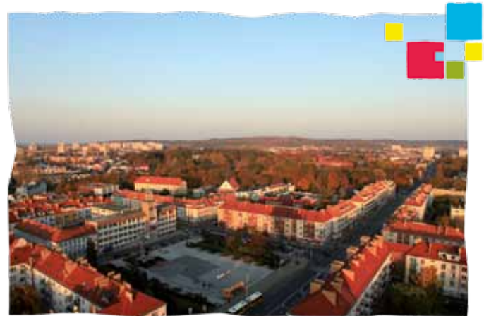
Koszalin - widok z lotu ptaka

Koszalin jako cel turystycznych wędrówek urzeka historyczną atmosferą oraz fascynującą współczesnością. Jest to bowiem miasto zarówno wielu zabytków gotyckich, jak i licznych nowoczesnych rozwiązań architektonicznych.