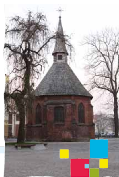
Kaplica p.w. św. Gertrudy

otworów okiennych, rozebranie wieży). Na początku XX w. przywrócono kaplicy funkcje sakralne i poddano ją restauracji, odtwarzając pierwotny wygląd. Po drugiej wojnie światowej pełniła funkcje magazynowe; mieściła się tu także Mała Scena Bałtyckiego Teatru Dramatycznego. W 1999 r. kaplica została przekazana parafii ewangelicko-augsburskiej i ponownie pełni funkcje sakralne.