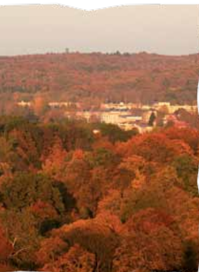
Park im. Księżąt Pomorskich

Dzierżęcinka i staw z Wyspą Łabędzi. Największym obiektem miasta jest Park Dendrologiczny, o powierzchni 8,5 ha, który ciągnie się wzdłuż Dzierżęcinki na północ od centrum miasta; niewiele mu ustępują Park przy Amfiteatrze oraz Park im. Tadeusza Kościuszki; tutaj również podziwiać można kilka pomników przyrody. Z inicjatywy społeczności osiedlowej powstał u podnóża Góry Chełmskiej Park Dostępny im. Władysława Turowskiego. Zupełnie inny charakter ma najmniejszy, założony przed 100 laty w formie rozarium, zrewitalizowany wspólnie Park Różany.