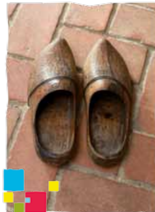
Drewniane chodaki jamneńskie

r. stanowią siedzibę Muzeum w Koszalinie.