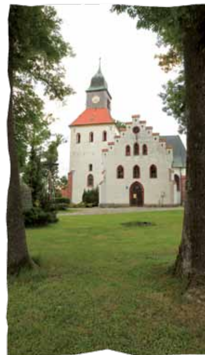
Kościół w Jamnie

ny wygląd świątynia uzyskała podczas barokowej przebudowy w 1737 r. i w tym stylu została odbudowana w 1927 r. po pożarze. Z czasów gotyckich zachowały się mury obwodowe, bryła wieży oraz narożne szkarpy dwuuskokowe. W stylu barokowym utrzymany jest hełm cebulasty wieży oraz pochodzące z XVIII w. wyposażenie wnętrza – drewniany, bogato polichromowany ołtarz główny z ludowymi figurkami apostołów św. Piotra i Pawła, ambona (1750) i chrzcielnica (1683).