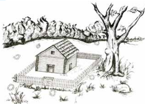
Gontyna pogańska - rekonstrukcja wg H. Janochy z publikacji „Góra Chełmska: miejsce dawnych kultów i sanktuarium Maryjne”, Koszalin 1991

pod Trzebiatowem. Na miejscu gontyny pogańskiej, między 1214 i 1217 r., wzniesiona została kamienna kaplica po-