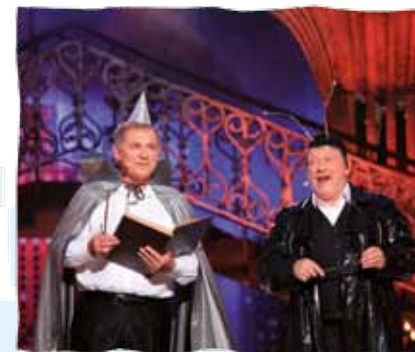
XVII Letni Festiwal Kabaretu

Najpopularniejszy kabaret w kraju odbywa się na deskach amfiteatru zawsze w ostatnią sobotę lipca. Na zaproszenie kabaretu Koń Polski zjeżdżają na występy do Koszalina czołowi satyrycy z całego kraju. Mottem festiwalu jest hasło: „Minuta śmiechu to dzień życia dłużej”, a puentą – finałowa, zawsze na czasie, satyryczna piosenka. Transmisje z tego