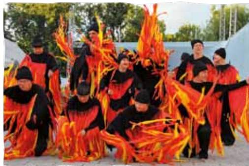
Europejski Festiwal „Integracja Ty i Ja”

Zapewnia solidne rockowe granie, można usłyszeć hard-rock, połączenie rocka z punkiem. Dziś, po trzydziestu latach działania, jest to jeden z ważniejszych festiwali na rockowej scenie kraju. Więcej na www.generacja.koszalin.pl .