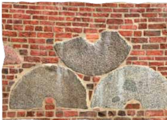
Kamienie młyńskie w średniowiecznych murach obronnych

palisadą, otoczony fosą i sta- umocnione 46 cztawnia- mi i 3 bramami, tworzyły za- mknęty pier- ścień. Grubość muru u pod- stawy wynosiła 1,30 m, a wy- sokość sięgała 7 m. Pierwotny system forty- fikacji Koszali- na, zbudowany po lokacji mia- sta, stanowił pierścień wa- łów ziemnych z drewnianą