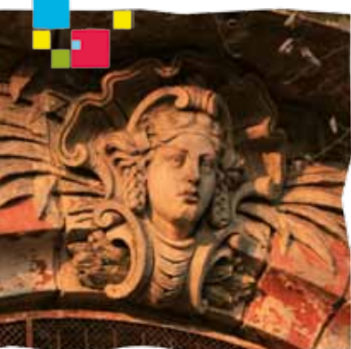
Plaskorzeźby na gmachu Rejencji

urzędu przeniesiono do nowo wybudowanego gmachu. Po drugiej wojnie światowej obiekt, wraz z kompleksem przyległych budynków administracyjnych, został przekazany na siedzibę komendy wojewódzkiej milicji; obecnie stanowi siedzibę Komendy Miejskiej Policji.