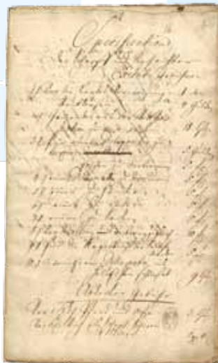
Cennik kata

Został wybudowany w 1973 r. z inicjatywy władz wojewódzkich i uczestników