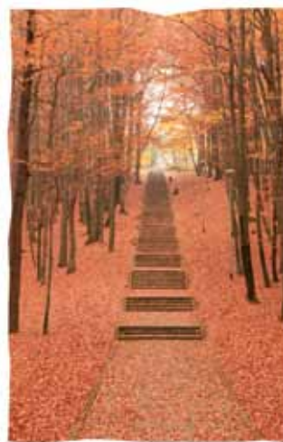
Droga do sanktuarium