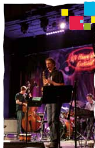
Hanza Jazz Festiwal

w Hadze. Ważne jest także to, że imprezę dla młodzieży przygotowują młodzi ludzie