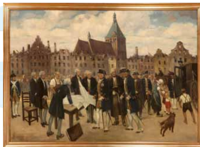
Koszalin po wielkim pożarze w 1718 r. Obraz olejny z XIX w. - Muzeum w Koszalinie

pierwszy pułk piechoty księcia Antoniego Pawła Sułkowskiego. Znacząca dla rozwoju Koszalina okazała się reforma państwa pruskiego w 1816 r., w wyniku której powołana została Regierungsbezirk Köslin (Rejencja Koszalińska) w granicach zbliżonych do województwa koszalińskiego z lat 1950-1977. Nastąpił wówczas znaczny rozwój gospodarczy. Wzrosła także liczba ludności, która w 1858 r. przekroczyła 10 tys.; w 1939