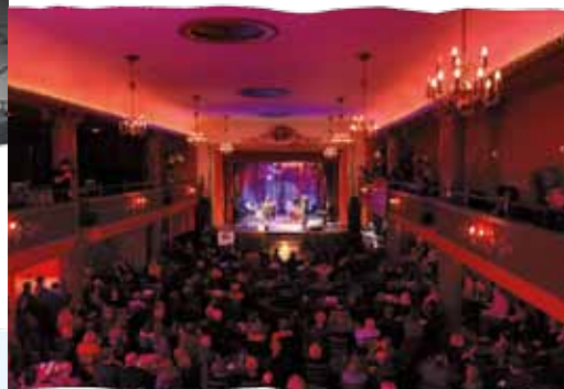
Teatr Variété „Muza”

widowisk dużym zainteresowaniem cieszyły się musical Cabaret oraz rewia latynoska Fiesta Latina , a z koncertów – występy duetu gitarowego z Chicago, wokalistki z Ja-