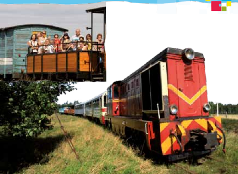
Koszalińska kolejka wąskotorowa

wahadłowo na trasie Jamno – Kanał Jamneński – Unieście. Zbudowany w stoczni rzecznej w Płocku płaskodenny statek zabiera na pokład 67 osób oraz rowery i wózki dla osób niepełnosprawnych. Rejs przez jezioro zajmuje zaledwie 20 minut, czyli dokładnie tyle, ile trzeba przeznaczyć na dojazd samochodem przy słabym natężeniu ruchu drogowego.