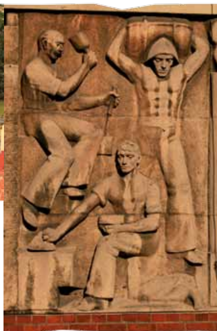
Plaskorzeźba na budynku BOŚ

Stanowią część dawnego browaru E. Aschera z 1846 r., istniejącego do 1910 r., który znajdował się na placu pomiędzy ul. Zwycięstwa a budynkiem straży pożarnej.