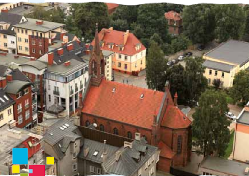
Kościół p.w. św. Józefa

nie kilka instytucji, m.in. Biuro Projektów Budownictwa Komunalnego, Wojewódzka Przychodnia Stomatologiczna, Przychodnia Neurologiczna, Archiwum Państwowe. Od 1988 r. budynek stanowi siedzibę Archiwum Państwowego w Koszalinie.