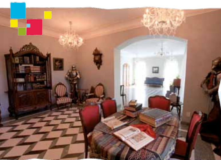
Muzeum Sztuki Książki