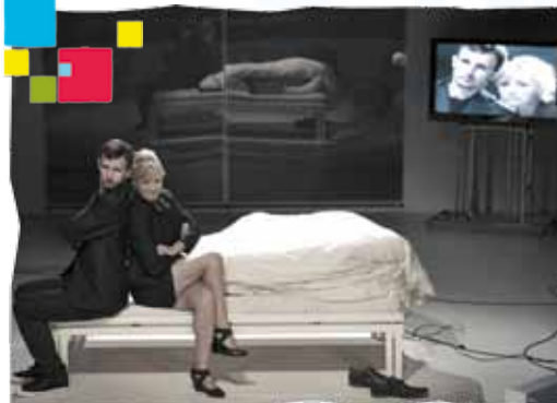
Spektakl „Kartoteka” w Bałtyckim Teatrze Dramatycznym.

1954 r. w wynajętej sali. Koszaliński przybytek Melpomeny w ramach akcji „Lato w teatrze” prowadzi warsztaty teatralne adresowane do młodzieży spędzającej wakacje w mieście. (ul. Heleny Modrzejewskiej 12) tel. 94 342 20 58 www.btd.koszalin.pl