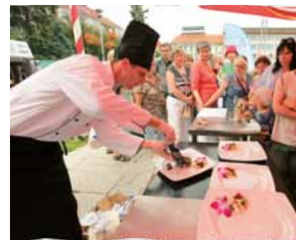
Koszaliński Festiwal Kulinaryny „Ulica Smaków”

nie tylko Koszalina, lecz także kuchni polskiej i innych krajów europejskich. Odbywa-