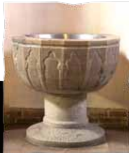
Chrzcielnica z XIII w.