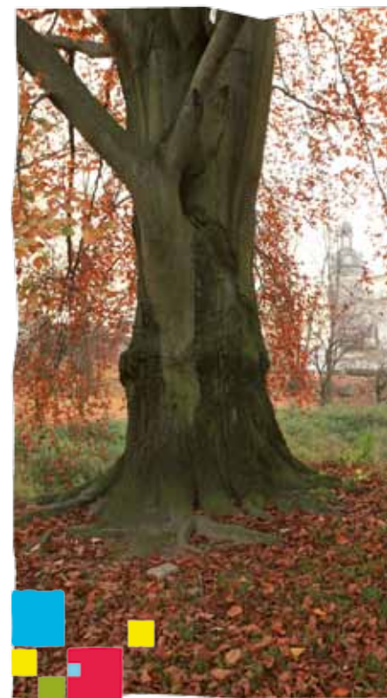
Buk czerwony - pomnik przyrody w Parku im. Księżąt Pomorskich

U podnóża północnych stoków Góry Chełmskiej, bezpośrednio przy drodze krajowej nr 6, znajduje się rezerwat przyrody nieożywionej typu glebowego „Bielica” o powierzchni zaledwie 1,3 ha. Przedmiotem ochrony jest typowo wykształcona próchnica na polodowcowych pokładach piaszczystych, porośnięta borem świeżym. Znacznie większy obszar – bo 370 ha – zajmuje rezerwat faunistyczny ptaków „Jezioro Lubiатовskie im. prof. Wojciecha Górskiego”, podzielony administracyjnie pomiędzy Koszalin i gminę Manowo. Panoramę tego akwenu można podziwiać z punktu widokowego na trasie szlaków turystycznych pomiędzy Lubiатовem a Manowem i Wyszehorzem. Najnowsze osiedle koszalińskie Jamnotabusz położone jest w granicach chronionego krajobrazu „Koszaliński Pas Nadmorski” z typowymi dla nizin nadmorskich i jezior przybrzeżnych pejzażami. Na terenie osiedla Tadeusza Kotarbińskiego utworzony został zespół przyrodniczo-krajobrazowy „Wąwozy Grabowe”, gdzie pośród drzew i krzewów tarniny szczególnie pięknie wiosną kwitną rośliny chronione: