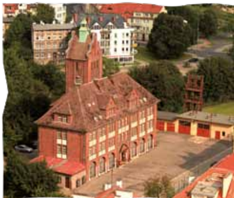
Budynek Straży Pożarnej

Jej najstarsze elementy znajdują się w ścianach bocznych i są to ostrołukowe blendy z XVI w. Kamienica uległa zniszczeniom podczas wielkiego pożaru miasta w 1718 r., później jednak została odbudowana. Do 1945 r. była użytkowana jako budynek mieszkalny. Po zniszczeniach w 1945 r. ponownie ją odbudowano. W latach 1969-1972 przeprowadzono remont kamienicy i adaptację wewnątrz na ekspozycje Muzeum Okręgowego. Od 1982 r. funkcjonuje jako Pałac Ślubów.