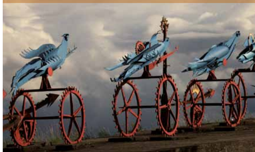
Pomnik „Tym, co walczyli o polskość i wolność Pomorza”- W. Hasiór

ściej wyszukiwał na złomowiskach, później sam spawał.