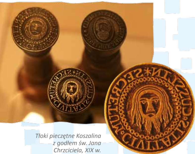
Tłoki pieczętnie Koszalina z godłem św. Jana Chrzyciela, XIX w. - Muzeum w Koszalinie

r. zaś Koszalin liczył 33,5 tys. mieszkańców. W XIX w. Koszalin zastąpił z fabryki wędzonych łososi i półgęsków, a przed pierwszą wojną światową – z produkcji części samolotowych LVG, filii zakładów lotniczych z Hamburga. Największym przed drugą wojną światową zakładem była nowoczesna fabryka papieru, która zatrudniała tysiąc osób; została ona spalona po wywiezieniu maszyn przez Rosjan w 1945 r.