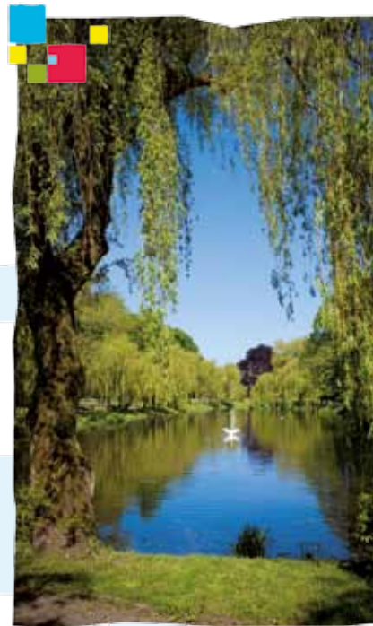
Park im. Książąt Pomorskich.

Najstarsza część parku, tzw. Stara Promenada, powstała w 1817 r. u podnóża murów obronnych. Do 1838 r. trwały prace związane z wytyczeniem alejek, budową fontanny, przebudową stawu i regulacją rzeki. W latach 1933-1934 staw odnowiono i założono wyspę dla łabędzi. Do najciekawszych okazów parku należą: mający ponad 300 lat klon jawor (tzw. Drzewo Czarownic), jedyna w Koszalinie magnolia drzewiasta, korkowiec amurski, cyprysik błotny i miłorząb dwuklapowy. Warto także przejść się aleją platanów klonolistnych.